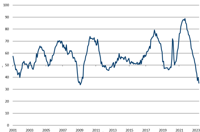
Abb. 3: Subkomponente «Lieferfristen» auf Mehrjahrestief Wachstumsschwelle = 50

Derweil meldet mehr als jedes vierte Unternehmen kürzere Wartezeiten im Einkauf als im Vormonat, während bei nur noch bei 4% mehr Geduld gefragt ist. Die Subkomponente «Lieferfristen» ist entsprechend weiter gesunken und notiert mittlerweile auf dem tiefsten Stand seit dem Jahr 2009 (vgl. Abb. 2). Auch die Einkaufspreise haben in der Summe im Mai nachgegeben. Die entsprechende Subkomponente notiert mit 44.3 Zählern aber etwas weniger weit unterhalb der Wachstumsschwelle als im Vormonat – dies aber nur, weil Preisnachlässe vergleichsweise seltener gewährt worden sind. Seltener geworden sind derweil Preiserhöhungen: Nur 9.7% der Unternehmen haben sich vergangenen Monat mit steigenden Einkaufspreisen konfrontiert gesehen – vor rund einem Jahr waren es noch 91%.