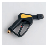
HD-Pistole M22 A Pistolet haute pression M22 A Art.-Nr. / N° article KCU999354 Ergonomisch geformt, mit Schnellverschluss Forme ergonomique, avec raccord rapide