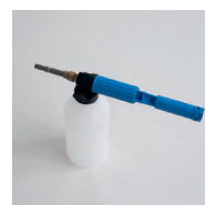
HD-Schaumkanone mit 2-Liter-Behälter Canon à mousse haute pression avec réservoir de 2 l Art. Nr. / N° article KCU999351 Zum Aufschäumen von neutralen und alkalischen Reinigern sowie Konservierern, mit Schnellverschluss. Pour rendre moussantes nettoyeurs alcalins et neutres ainsi que les conservateurs, avec raccord rapide