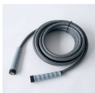
HD-Schlauch Premium, grau, 10 m Tuyau haute pression Premium, gris, 10 m Art.-Nr. / N° article KCU999507 Verstärkt, abriebfest, mit Handschraubung Renforcé. résistant à l'abrasion, avec vissage manuel