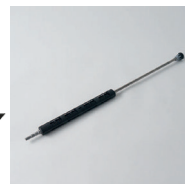
HD-Lanze 80 cm Edelstahl, gerade Lance haute pression 80 cm en acier inox, droite Art. Nr. / N° article KCU999506 Extra kurze, gelenkschonende Lanze für beengte Umgebungen, mit Schnellverschluss. Lance ultra-courte avec raccord tournant pour les endroits difficiles d'accès, avec raccord rapide