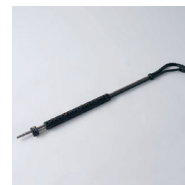
HD-Lanze Push & Pull Lance haute pression Push & Pull Art. Nr. / N° article KCU999505 Lanze mit verstellbarem Winkel ideal für Schweller und Radinnenkästen, mit Schnellverschluss Lance avec coude réglable idéale pour les seuils et passages de roues intérieurs, avec raccord rapide